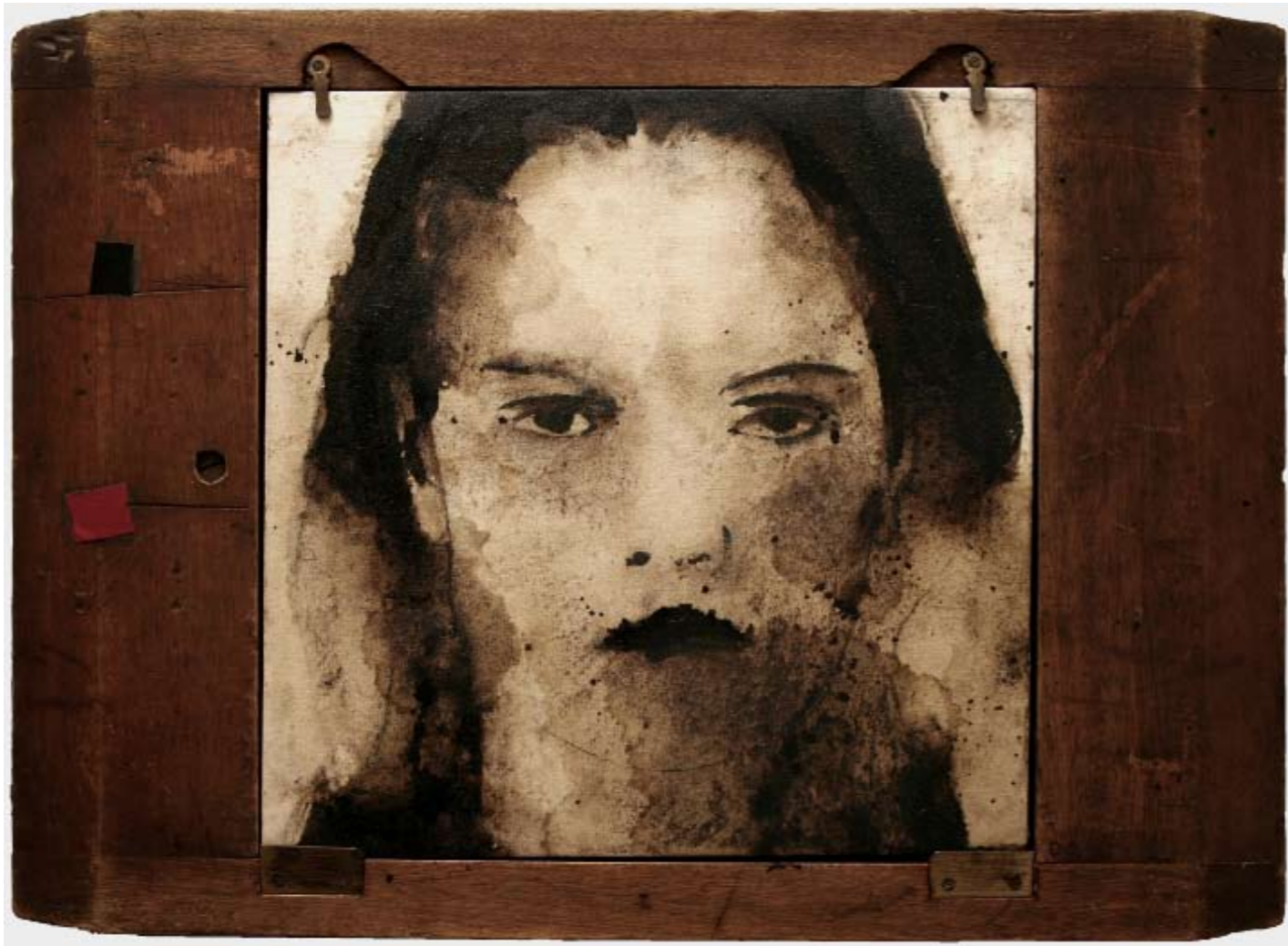
Memorie , 2009. Bitume, carboncino e legno, cm 36x50.