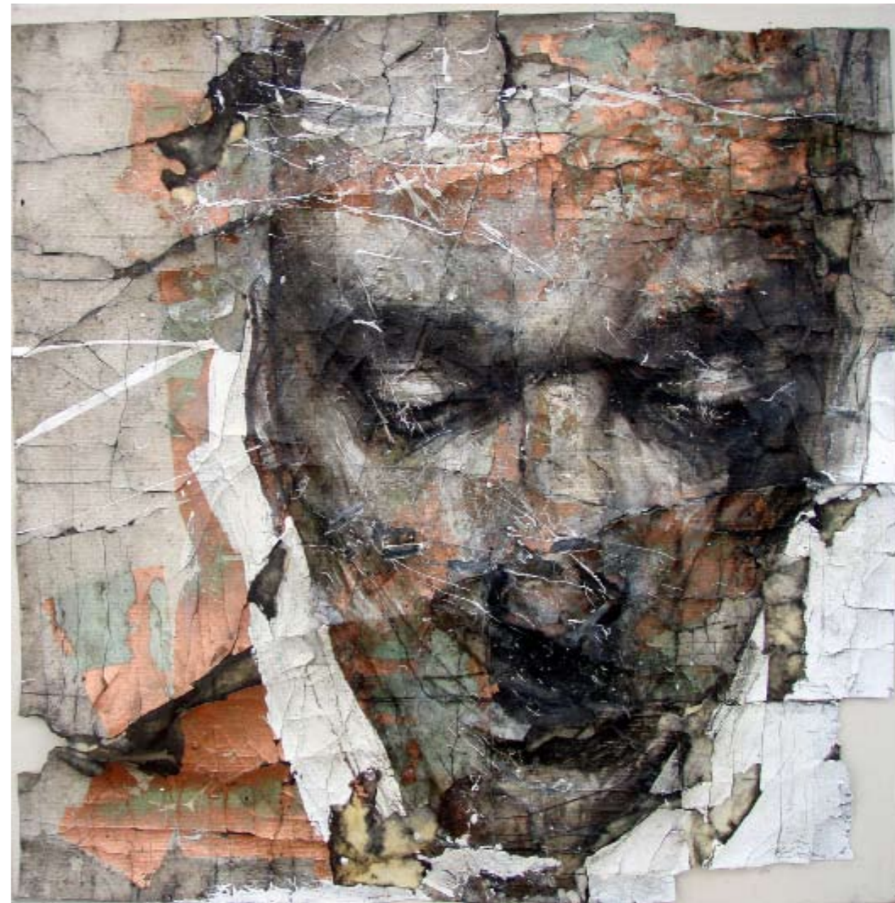
Blackcoal , 2009. Tecnica mista con cera d'api e cenere, cm 40x40.