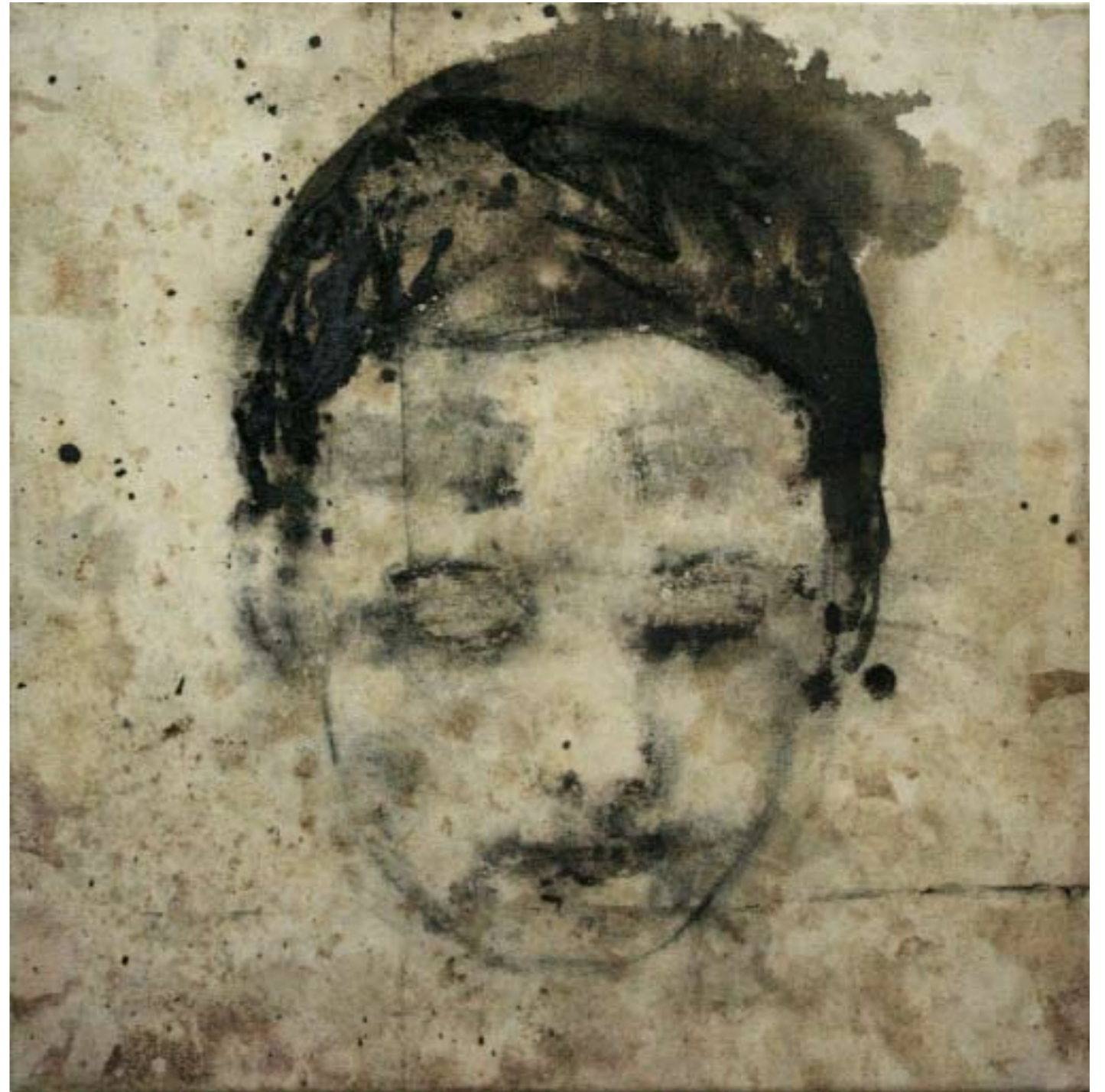
Testa , 2007. Bitume, olio e carboncino su tela, cm 50x50.