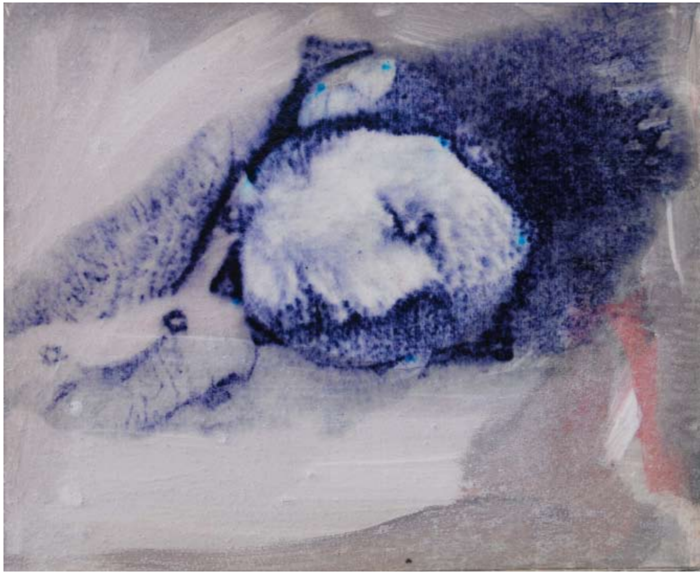
Psiconauta , 2009. Tecnica mista e poliestere su tavola, cm 40x50.