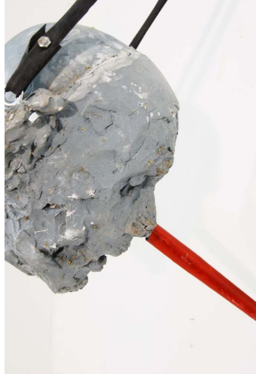
I figli dell'industria , 2009. Vetroresina, fasce elastiche, ferro e pigmenti, cm 110x35x50. Intero e particolare.