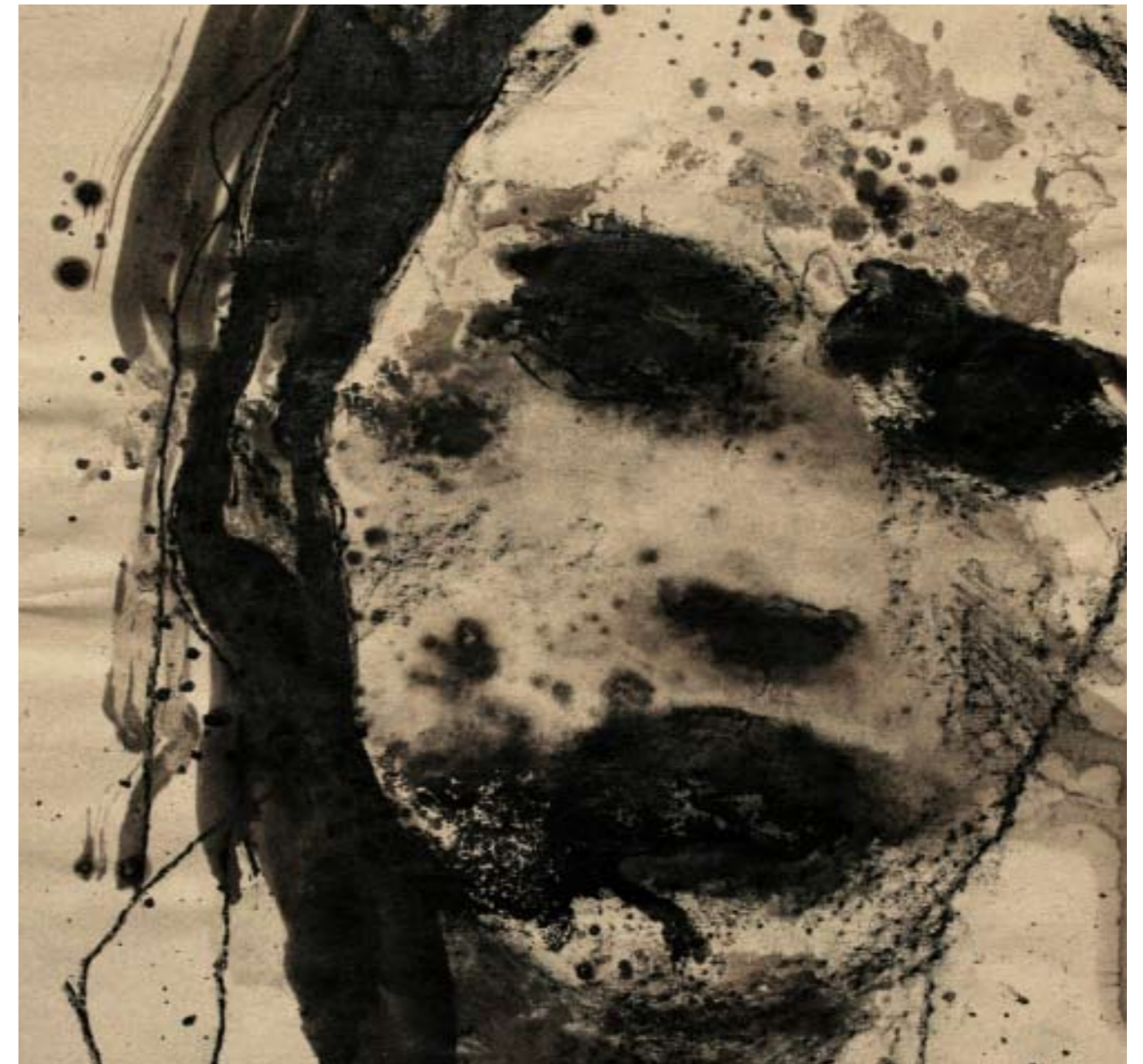
Face , 2007. Bitume e carboncino su carta, cm 25x25.