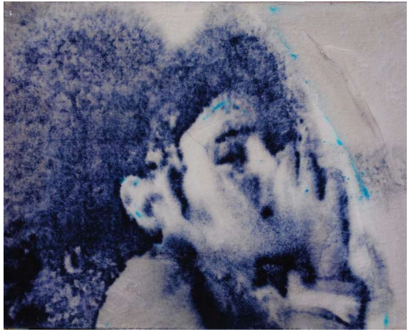
Psiconauta , 2009. Tecnica mista e poliestere su tavola, cm 40x50.