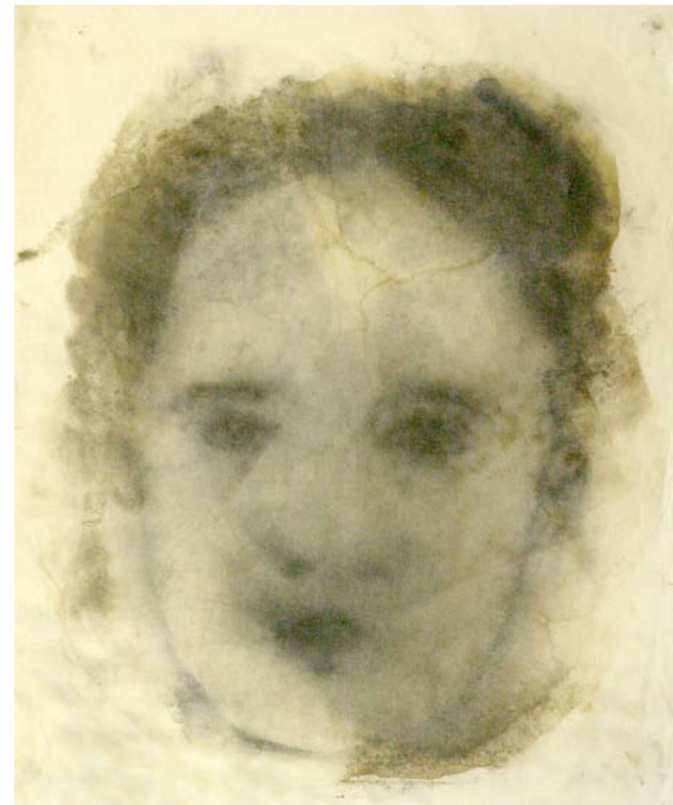
Memorie (trittico), 2009. Bitume e carboncino su carta, cm 65x54 ogni elemento.