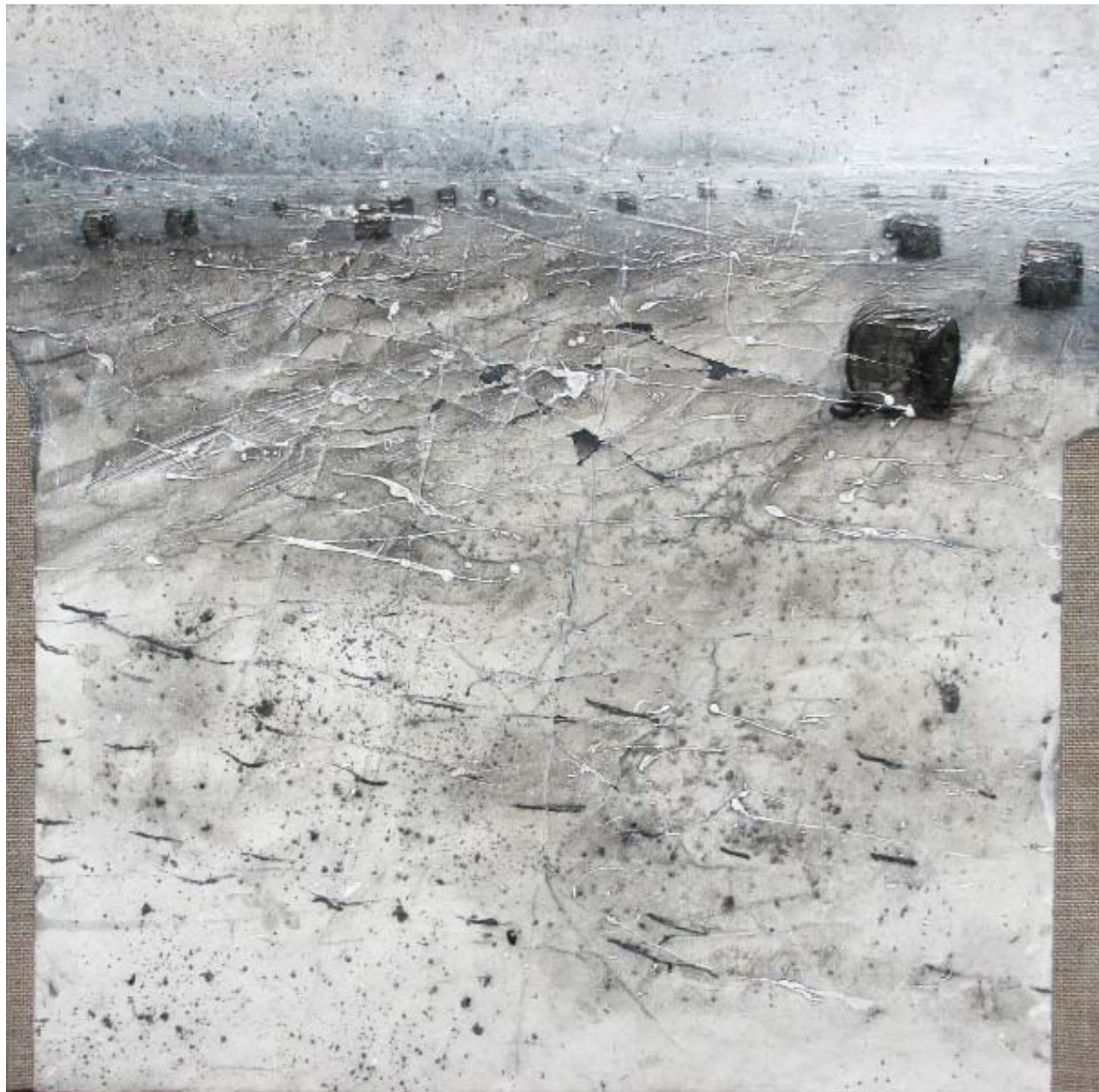
Meta fisica , 2009. Tecnica mista con cenere su tela, cm 40x40.