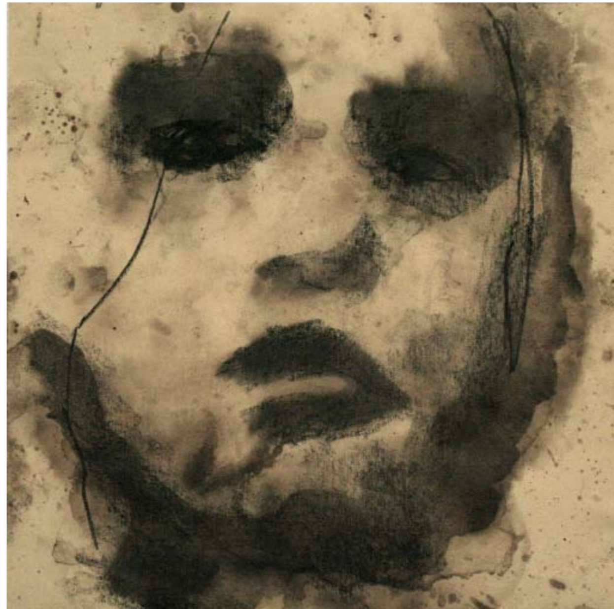
Face , 2007. Bitume e carboncino su carta, cm 25x25.