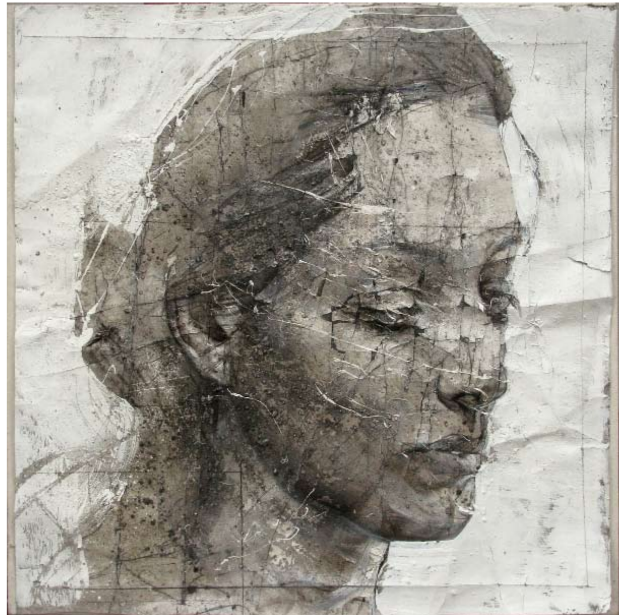
Blackcoal , 2009. Tecnica mista con cenere su carta, cm 40x40.