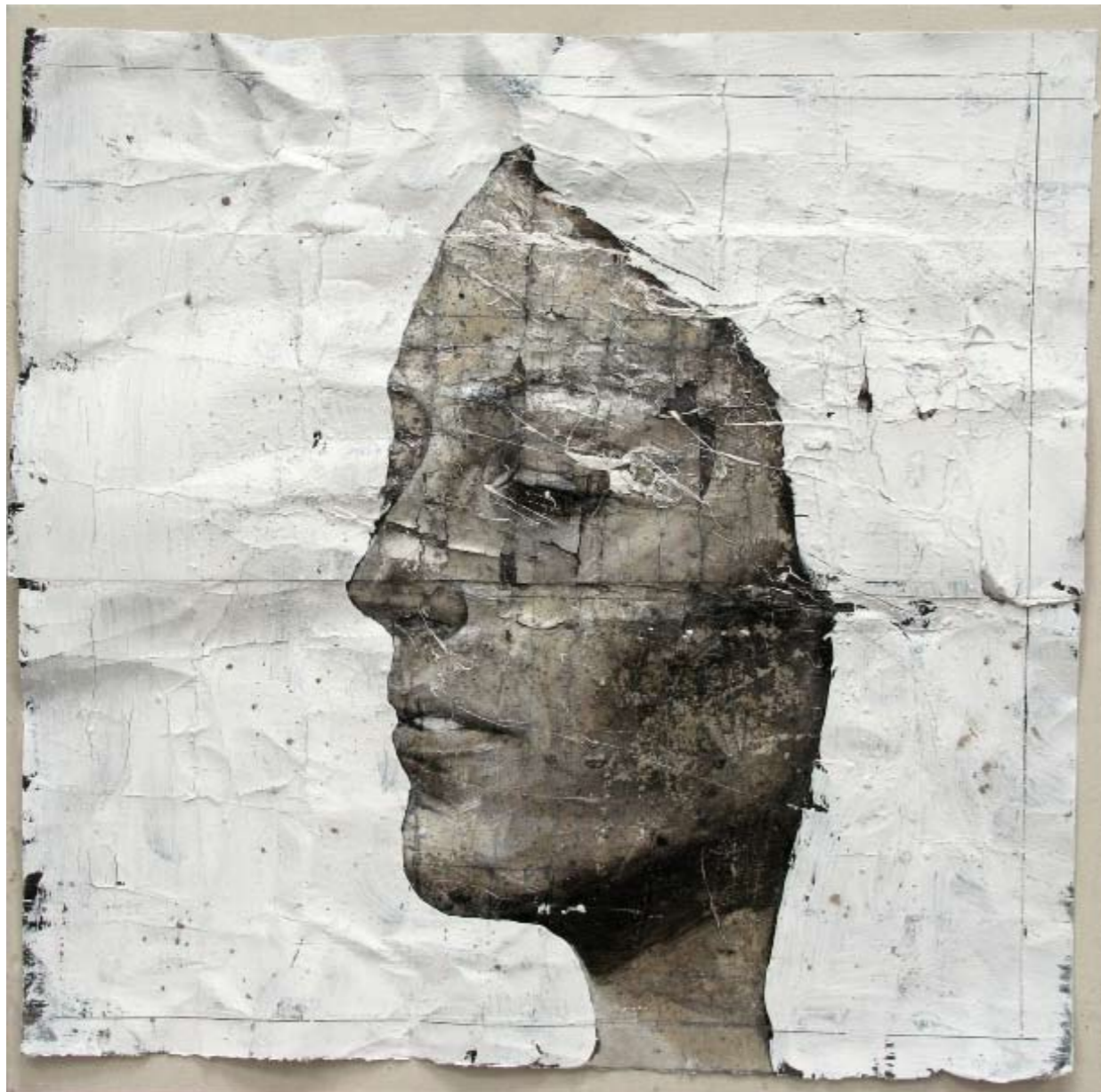
Blackcoal , 2009. Tecnica mista con cenere su carta, cm 40x40.