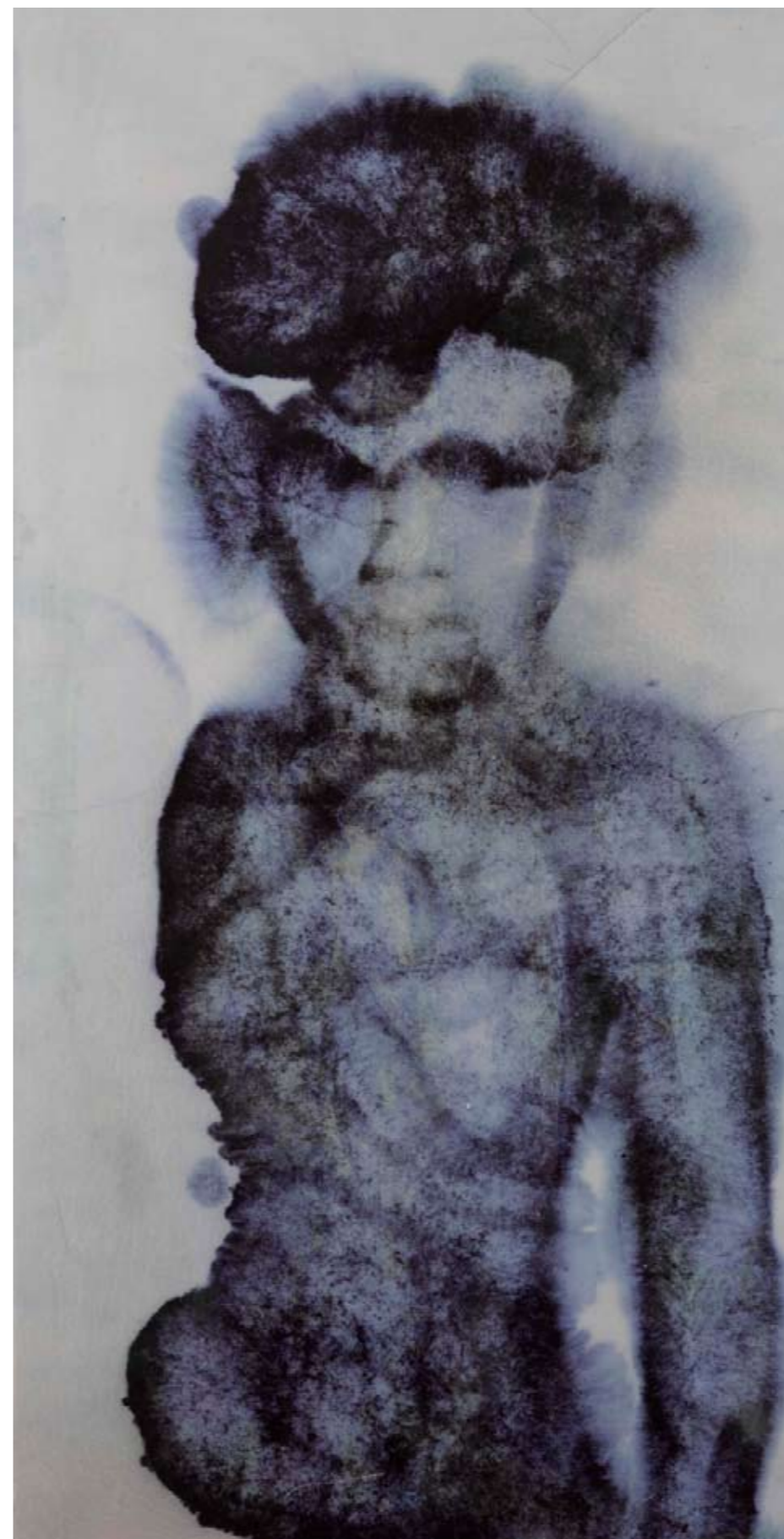
Senza titolo , 2008. Tecnica mista e poliesteri su tavola, cm 173x90.