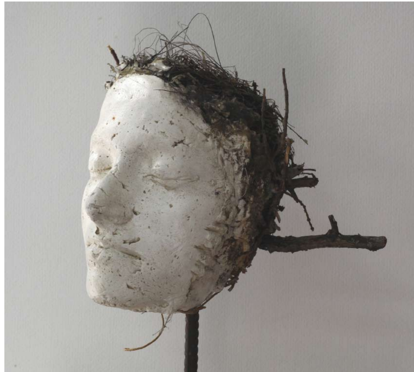
Imprinting , 2009. Gesso, nido, cera d'api, altezza scultura cm 40, basamento in ferro cm 20x25.