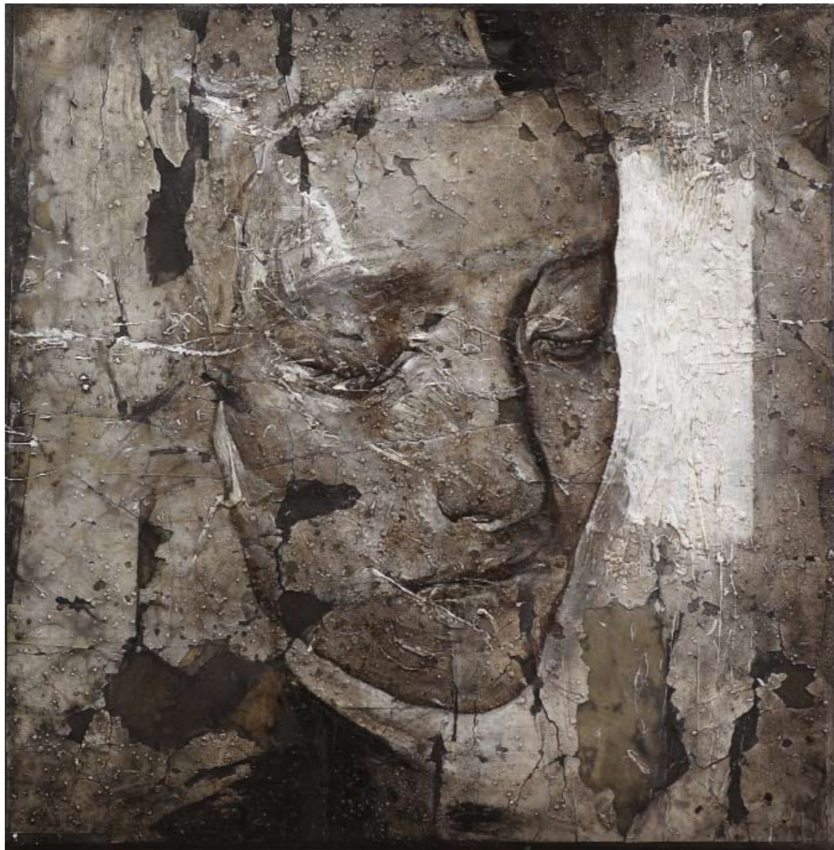
Imprinting , 2009. Tecnica mista con cera d'api e cenere, cm 40x40.