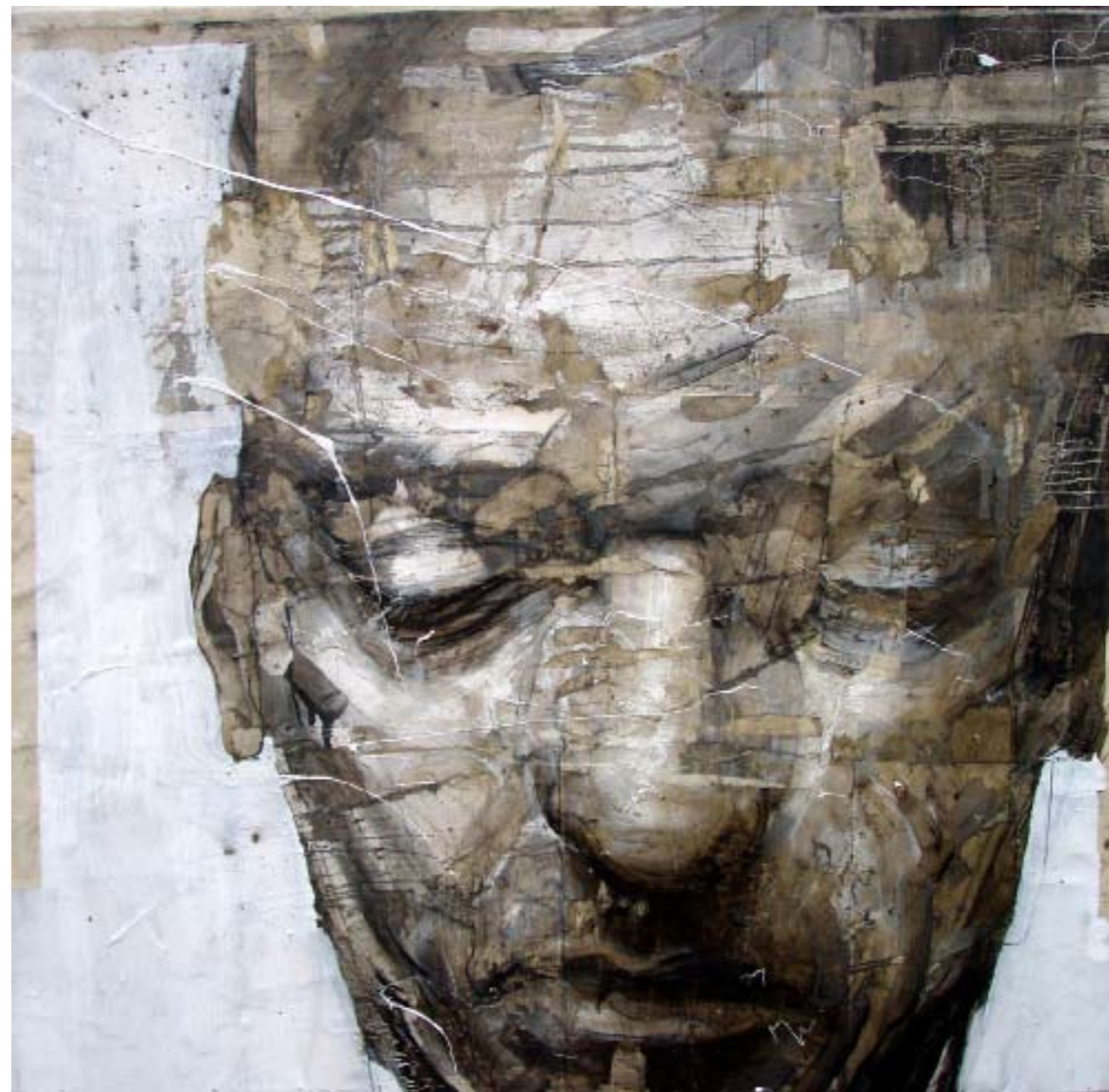
No more me , 2009. Tecnica mista con fuliggine su tela, cm 85x85.